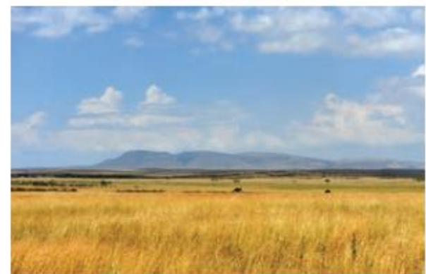
2. ábra. Az Egyenlítőtől távolodva csökken a csapadék, ami jól tükröződik a növényzet változásában.