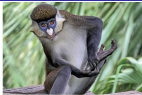
7. ábra. A cercófok elsősorban növényevők, főleg gyümölcsökkel táplálkoznak, de rovarokat is fogyasztanak.