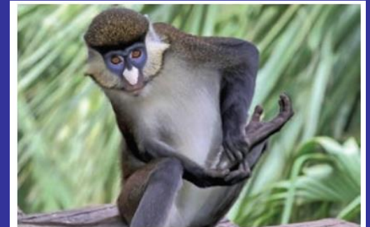
7. ábra. A cercófok elsősorban növényevők, főleg gyümölcsökkel táplál- nak, de rovarokat is fogyasztanak.